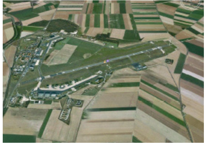
Vue aérienne du site