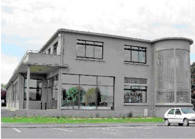
Bâtiment de restauration